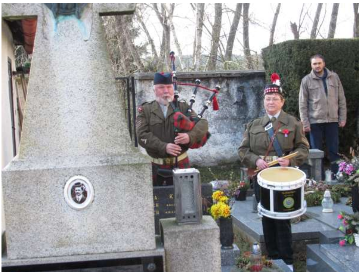
Dudáci v akci