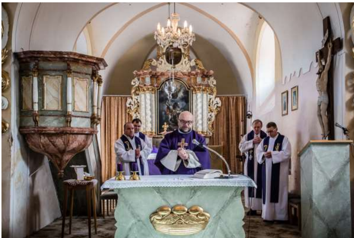
Mše ve Lhoticích