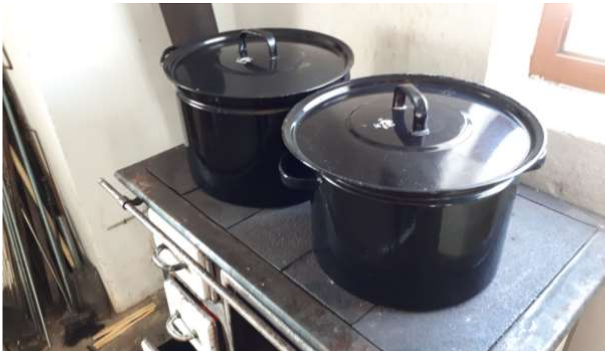
Příprava teplých nápojů