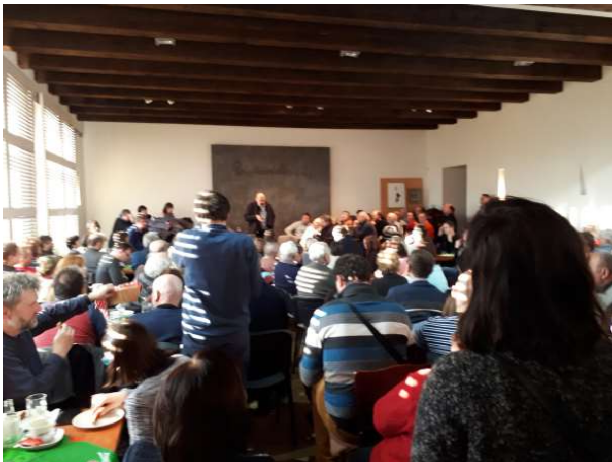
Kaliště – penzion u Mahlera