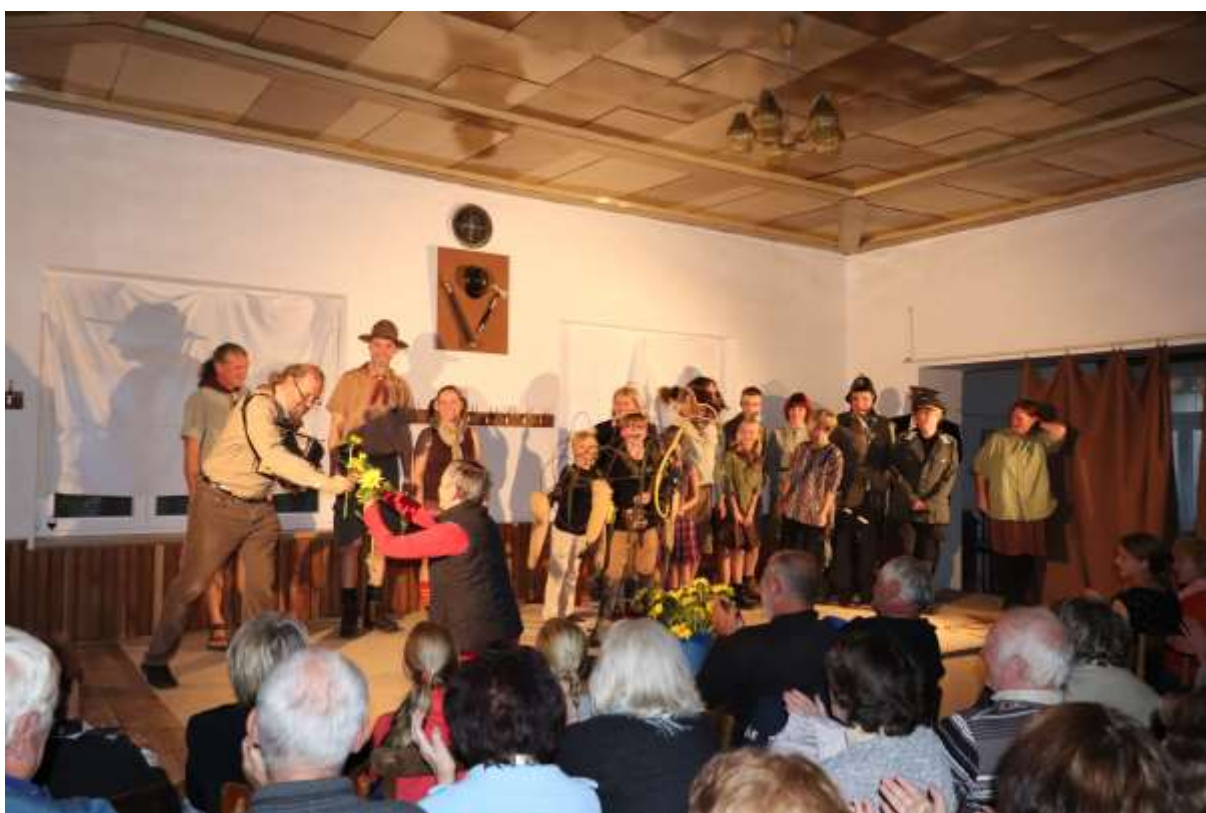
A je to za námi