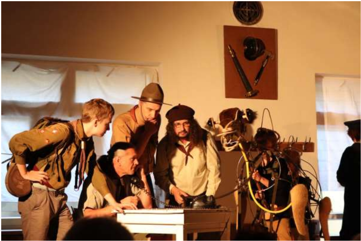
Je tam pan ředitel?