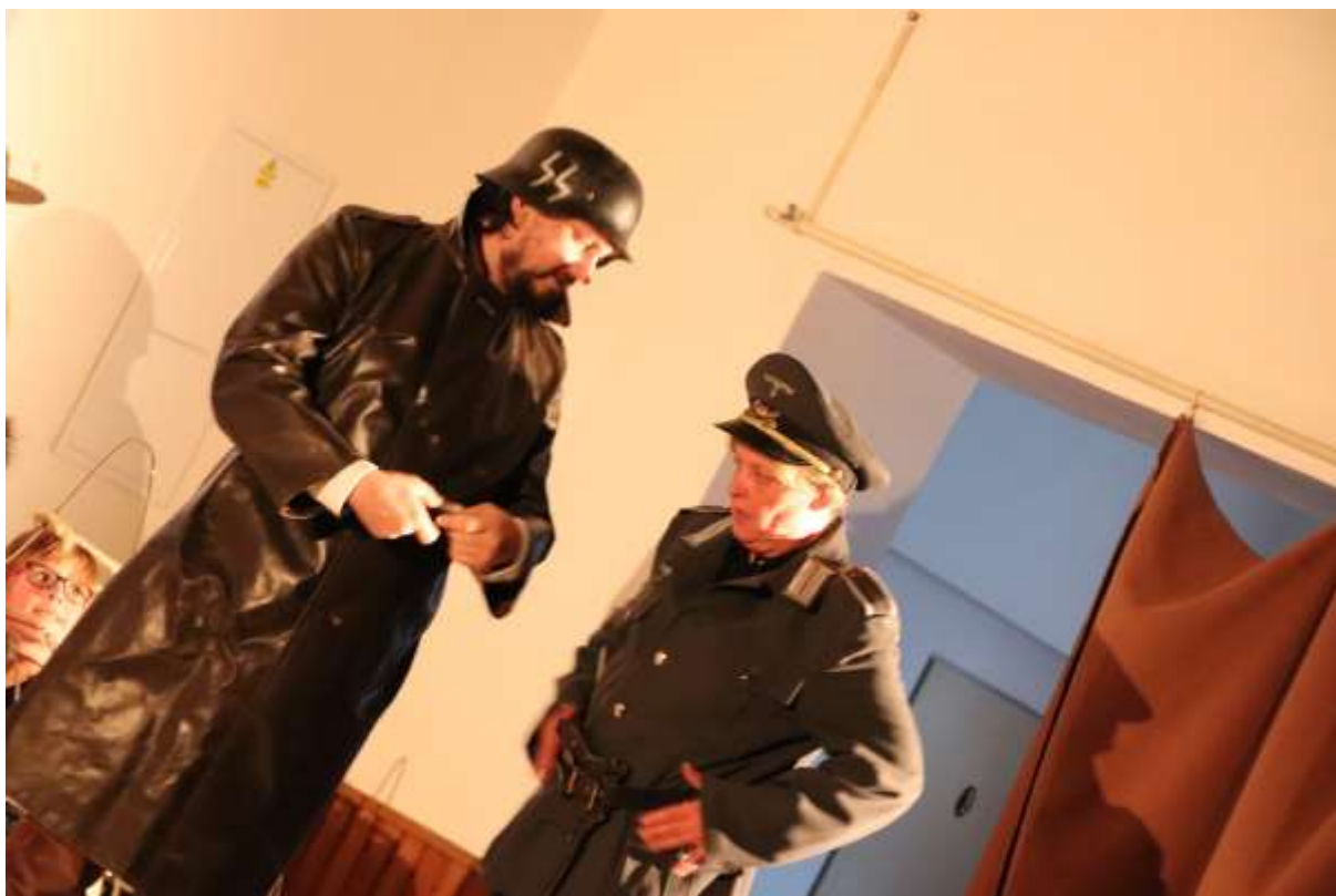
Jde z nich strach