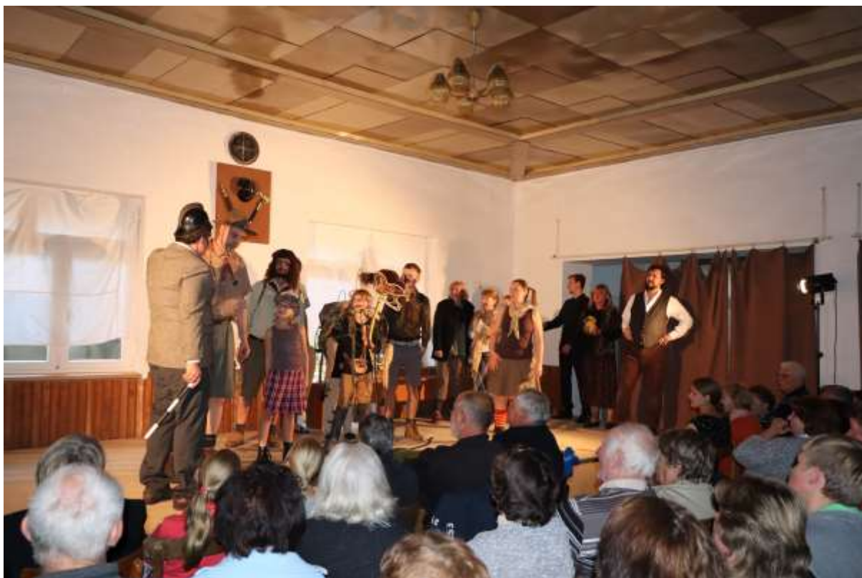
Ivan nezná slitování