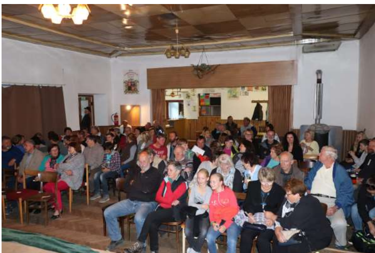
Jdeme na to